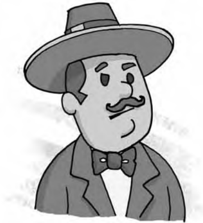
Figura 11 – Coronel Teodorico (Ilustração de Mauricio Loyola)

Emília - boneca de pano, astuta, insubmissa, irreverente, com grande poder de persuasão e a mais representativa personagem do Sítio do Picapau Amarelo, visto que Lobato a utiliza para tratar de temas polêmicos e questionar valores estabelecidos. Emília vive em tensão dialética com os outros personagens do Sítio, pois desfruta de imensa autonomia que, conforme confissão de Lobato, nem mesmo ele pode controlar.