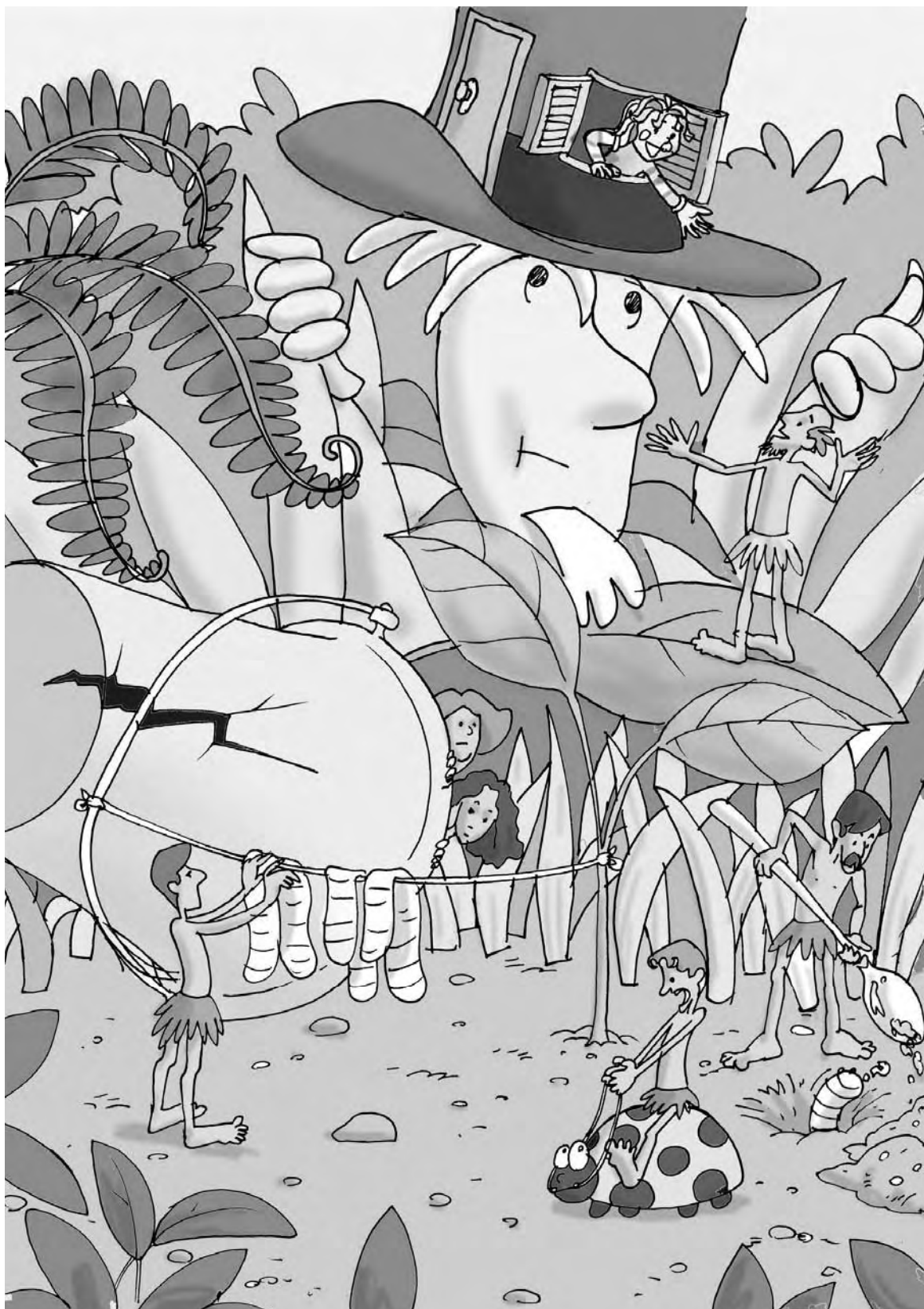
Figura 19 – A civilização de Pail City , uma nova forma de explorar a natureza. (Ilustração de Mauricio Loyola)