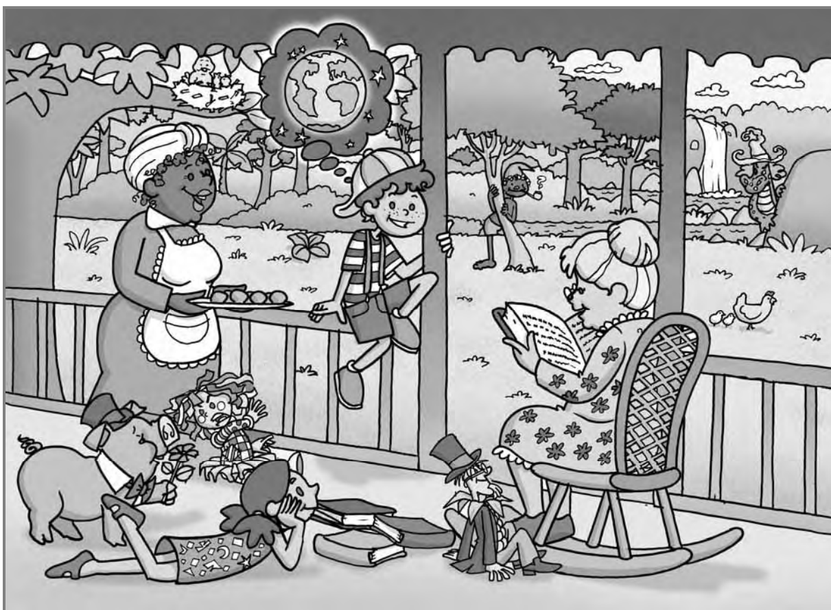
Figura 5 – O Sítio do Picapau Amarelo e alguns de seus personagens.

Ao construir o universo ficcional do Sítio do Picapau Amarelo, Lobato recorreu às memórias de sua infância vivida em Taubaté, conforme escreveu a Rangel. “Há [...] lembranças de meninice que jamais se apagam do cérebro adulto, mesmo quando esse receptor de impressões não consegue, por fraqueza senil, reter as da véspera.” (CAVALHEIRO, 1955b, p. 28)