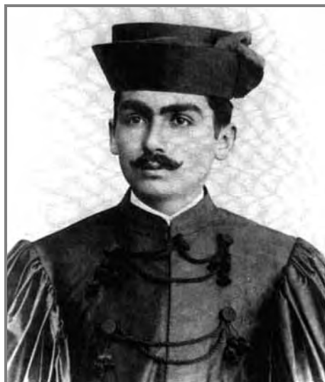
Figura 3 – Lobato após colação de grau, em 15 de dezembro de 1904. (Reprodução de CAVALHEIRO, 1955a)

e científicas que se proliferavam pelo mundo, ele iniciou sua carreira literária, escrevendo contos, artigos e crônicas para jornais do interior e da capital paulista.