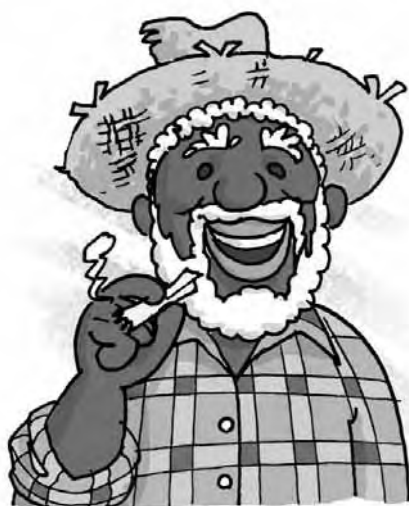
Figura 9 – Tio Barnabé (Ilustração de Mauricio Loyola)

Tio Barnabé – agregado de Dona Benta que habita um rancho de sapé isolado no Sítio do Picapau Amarelo, também detentor da sabedoria popular e representante do povo brasileiro nas histórias infantis do escritor. Os agregados, assim como a servidão de Tia Nastácia, representavam formas de dominação do trabalho livre, surgidas no período pós-abolição. Monteiro Lobato criticava essa dominação pela sua ineficiência, visto que os agregados não dispunham de terra própria e, por isso, não criavam vínculo com as terras onde moravam, situação que os desestimulava a utilizar modernas técnicas para o plantio e a promover benfeitorias nessas terras. Logo, essa forma de trabalho livre dificultava, ainda mais, o desenvolvimento econômico do país.