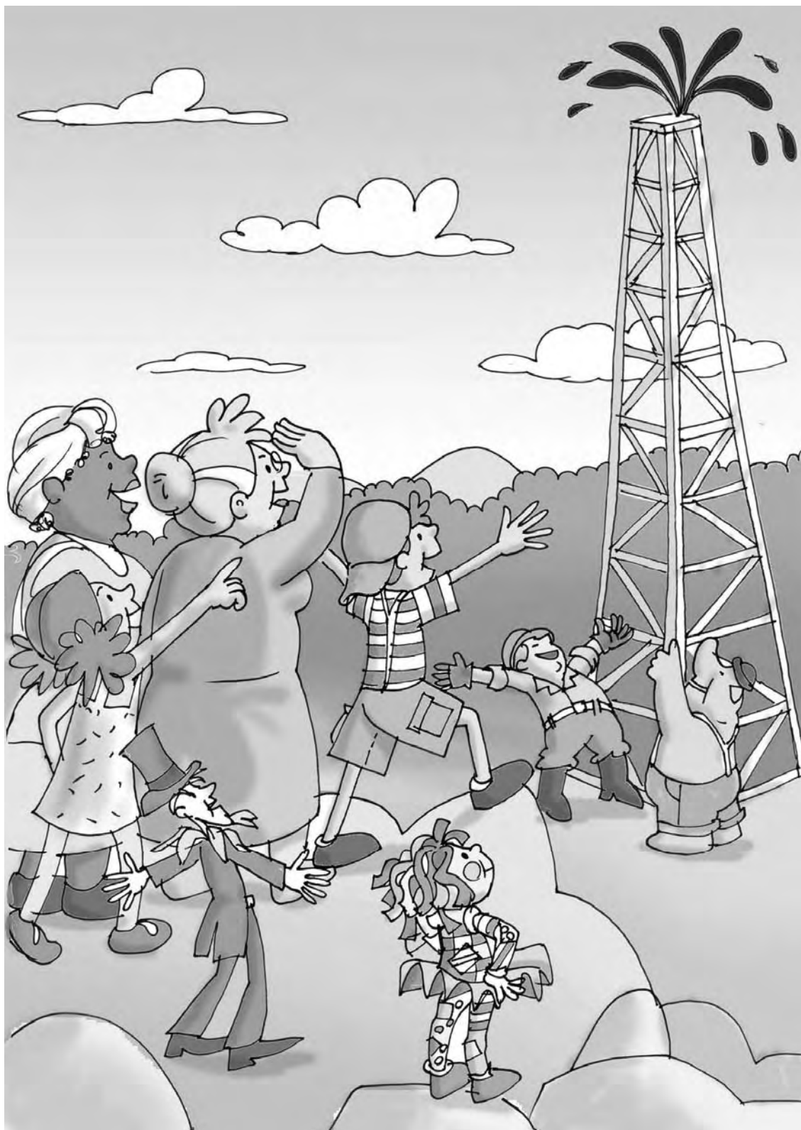
Figura 18 - O petróleo jorrando no Sítio do Picapau Amarelo. (Ilustração de Maurício Loyola)