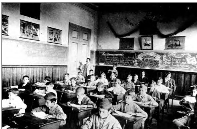
Figura 2 – A rígida disciplina de uma aula na Escola Caetano de Campos, em São Paulo, no início do século XX.

Logo no início do período republicano, as disciplinas ensinadas para as crianças da elite que freqüentavam a escola eram, com maior ênfase, as línguas estrangeiras (principalmente, o francês com o qual se comunicavam professores e alunos em sala de aula), noções de cálculo, Geografia e História e, por fim, o ensino da Língua Portuguesa. A Geografia, em especial, ganhava destaque nas escolas dessa fase, porém, seu programa de ensino contemplava a memorização e a enumeração de fatos sem significados para os alunos, uma vez que eles não se relacionavam com a realidade próxima deles.