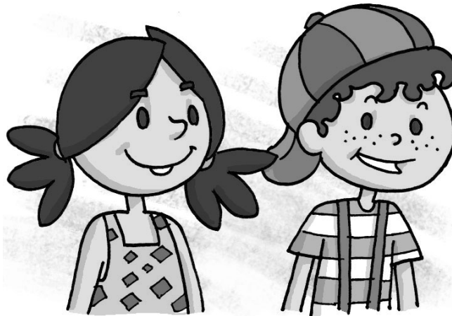
Figura 8 – Pedrinho e Narizinho (Ilustração de Mauricio Loyola)

Pedrinho e Narizinho - arquétipos de crianças da burguesia agrária. São crianças felizes, questionadoras e independentes, adaptáveis e abertas ao novo, por isso, Lobato deposita nelas a esperança de mudanças para o país. Esses personagens representam a futura elite dirigente do Brasil, assim, recebem melhor educação para que o poder de governar o país continue nas mãos da classe dominante, porém mais esclarecida.