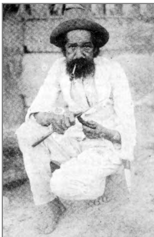
Figura 4 – Um Jeca Tatu “autêntico”. (Reprodução de AZEVEDO et al., 1997)

a nossa literatura é fabricada nas cidades por sujeitos que não penetram nos campos por medo de carrapatos. [...] Minha sorte foi ter caído um pedaço de terra em minhas mãos. Se não houvesse virado fazendeiro e visto como é realmente a coisa, o mais certo era estar lá na cidade a perpetuar a visão erradíssima do nosso homem rural. (LOBATO, 1956, p. 60).