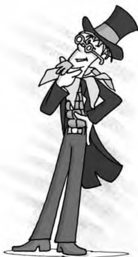
Figura 13 - Visconde de Sabugosa (Ilustração de Mauricio Loyola)

Visconde de Sabugosa - sabugo de milho científico, representante da ciência positivista. Visconde de Sabugosa e Dona Benta são os personagens que ensinam Geologia e Geografia à turma do Sítio do Picapau Amarelo. Ele também representa a prudência e a experiência, comportamentos comuns a um adulto e não a uma criança.