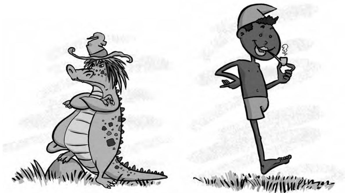
Figura 14 – Cuca e Saci (Ilustrações de Mauricio Loyola)

Além de Visconde de Sabugosa e Emília, Monteiro Lobato criou outros personagens fantásticos para fazer parte do Sítio do Picapau Amarelo, como o Marquês de Rabicó (um leitão glutão que se casou com Emília), o Conselheiro (Burro Falante) e o Quindim (rinoceronte que representa a força).