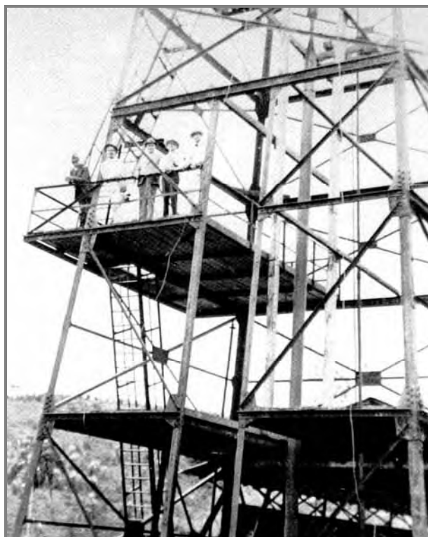
Figura 15 – Monteiro Lobato (2º à direita) em uma torre de perfuração de petróleo no campo de Araquá, no município paulista de São Pedro. (Reprodução de AZEVEDO et al., 1997)

Com isso, Lobato foi diretamente contra a política energética do governo Vargas e, portanto, não se articulou com o projeto corporativo que previa o Estado gerindo nossos recursos naturais, compartilhado entre esse governo e a burguesia industrial representada pelos industriais da FIESP (Federação das Indústrias do Estado de São Paulo) e da CIESP 28 (Centro das Indústrias do Estado de São Paulo).