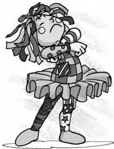
Figura 12 – Emília (Ilustração de Mauricio Loyola)

Emília - boneca de pano, astuta, insubmissa, irreverente, com grande poder de persuasão e a mais representativa personagem do Sítio do Picapau Amarelo, visto que Lobato a utiliza para tratar de temas polêmicos e questionar valores estabelecidos. Emília vive em tensão dialética com os outros personagens do Sítio, pois desfruta de imensa autonomia que, conforme confissão de Lobato, nem mesmo ele pode controlar.