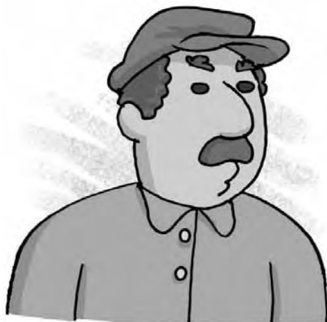
Figura 10 - Elias Turco (Ilustração de Mauricio Loyola)

Em virtude das condições conjugadas da economia de guerra, das dificuldades de importação, da carestia e inflação disparadas, tornavam-se práticas difundidas no comércio a falsificação de rótulos e embalagens estrangeiros, a criação de sucedâneos brasileiros espúrios dos gêneros de difícil ou impossível importação e a adulteração de alimentos pelo acréscimo de substâncias estranhas, quando não tóxicas ou venenosas. (SEVCENKO, 1992, p. 134)