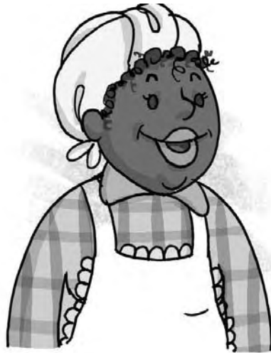
Figura 7 - Tia Nastácia (Ilustração de Mauricio Loyola)

Tia Nastácia – afetuosa, humilde e detentora de bom-senso. Tia Nastácia, que é descendente de escravos, representa o povo brasileiro e a cultura popular. É a única personagem que trabalha no Sítio do Picapau Amarelo, pois o negro, no contexto da Primeira República, representava, quase que exclusivamente, a classe servil do país.