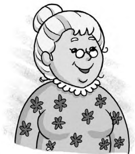
Figura 6 - Dona Benta (Ilustração de Mauricio Loyola)

Dona Benta - a avó ideal, carinhosa e culta. Proprietária do Sítio do Picapau Amarelo e autoridade principal desse lugar. Comanda o Sítio usando do conhecimento e da sabedoria para educar os netos, respeitando-lhes a autonomia e a liberdade de pensamento. Dona Benta representa a burguesia agrária que Lobato almejava para o país, ou seja, letrada e culta, aberta a mudanças, além de ser preocupada em melhorar as condições de vida do povo do interior.